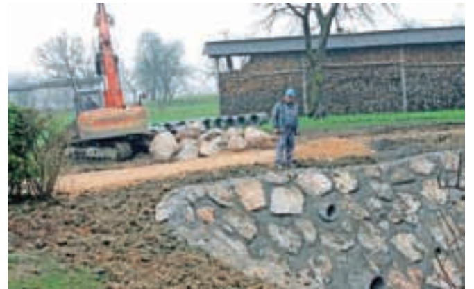
Udor ceste na Hudem so že sanirali, izvajalec del je bilo podjetje VGP Kranj.