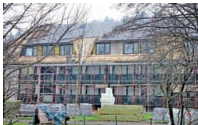
V začetku jeseni so začeli menjati dotrajano streho na Domu Petra Uzarja.

Tržič – Na Domu Petra Uzarja so jeseni začeli z menjavo strešne kritine, z deli naj bi v grobem končali do konca leta, nekateri zaključki, kot so fasaderska dela, pa bodo verjetno počakala na ugodne vremenske razmere. "V celoti streho financiramo z lastnimi sredstvi – zaradi dotrajane strešne kritine ni bilo več mogoče čakati na možnosti novih razpisov, saj je v dom že zamakalo. Ob tem izvajamo tudi energetske sanacije